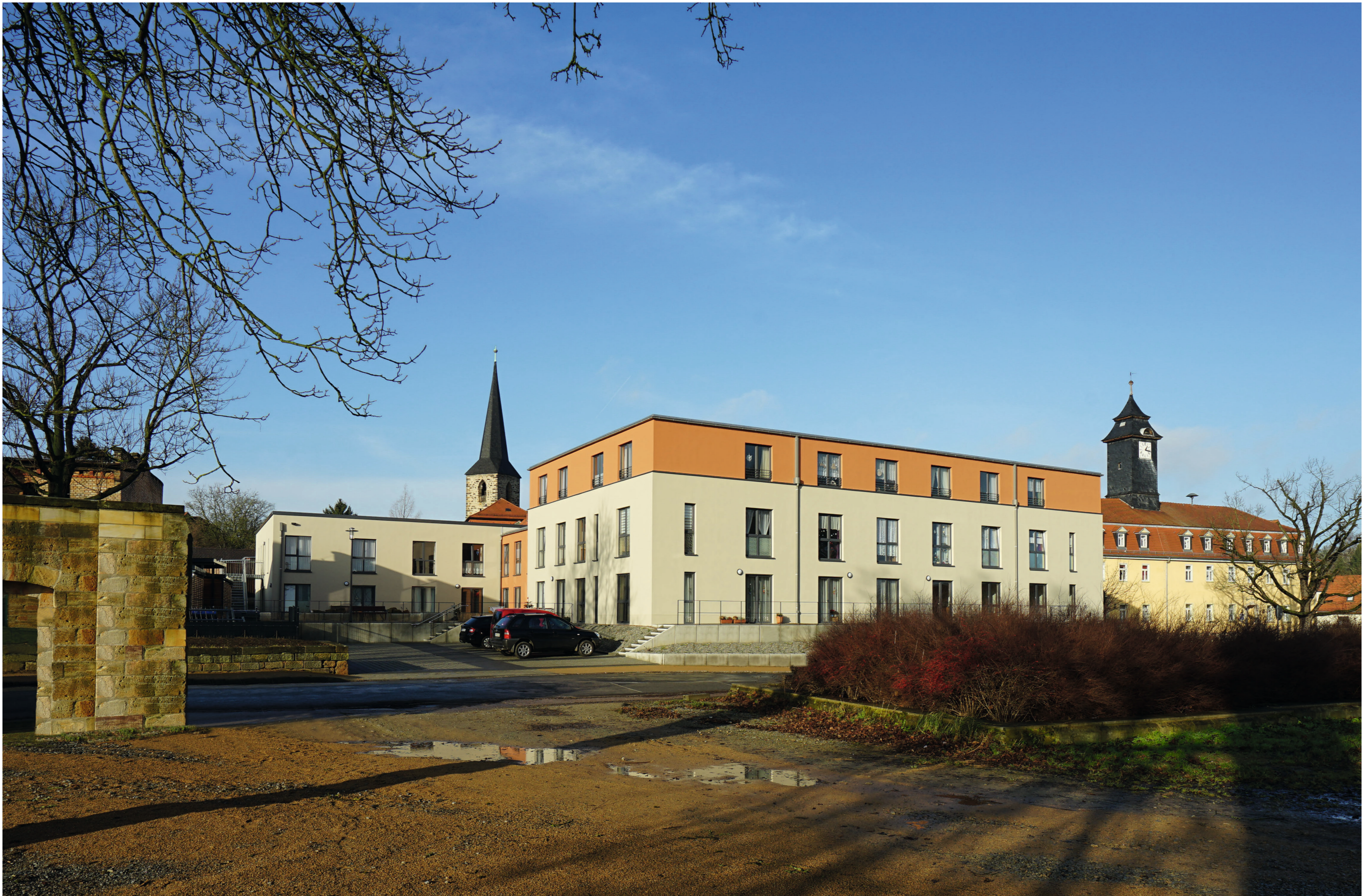
Mittendrin – Wohnen neben Rathaus und Kirche