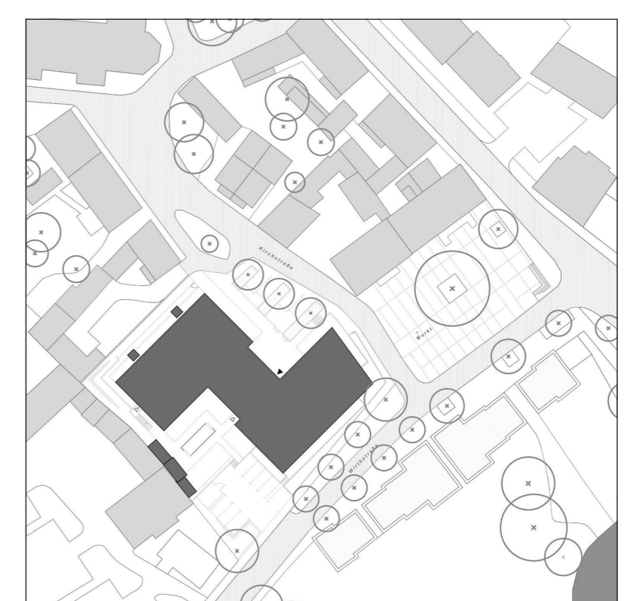
Lageplan und Grundriss Erdgeschoss | Pläne: Gerotekten