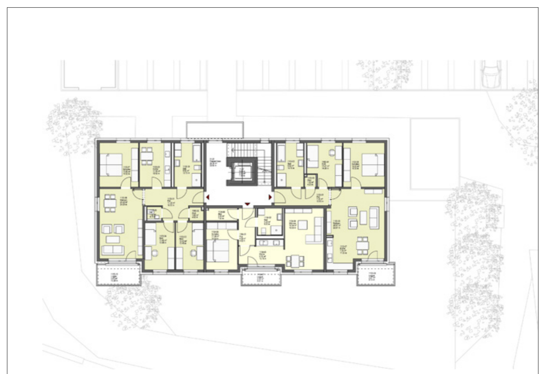
Grundriss Obergeschoss | Plan: