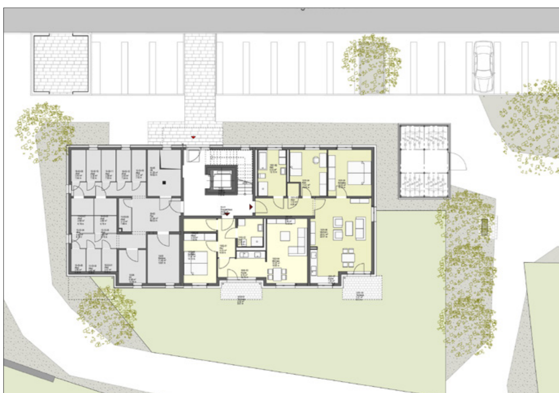
Grundriss Erdgeschoss | Plan: