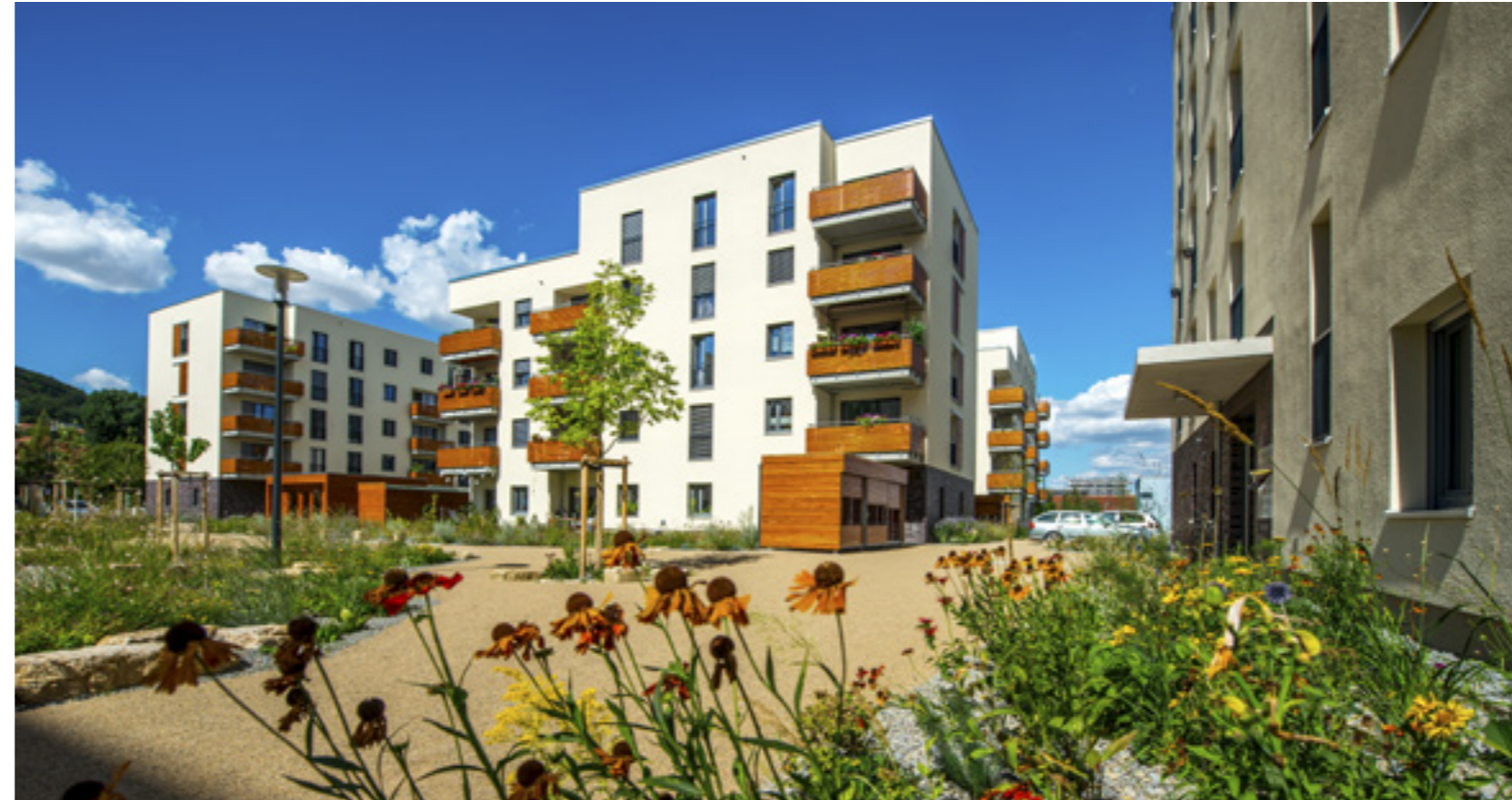
Innenhof 1