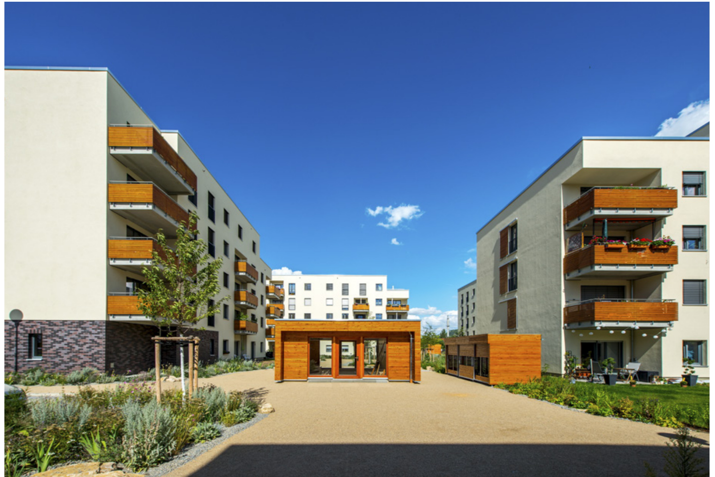
Gartenpavillon | Foto: grafiker.org

Generalplaner Wagner + Günther Architekten, Jena