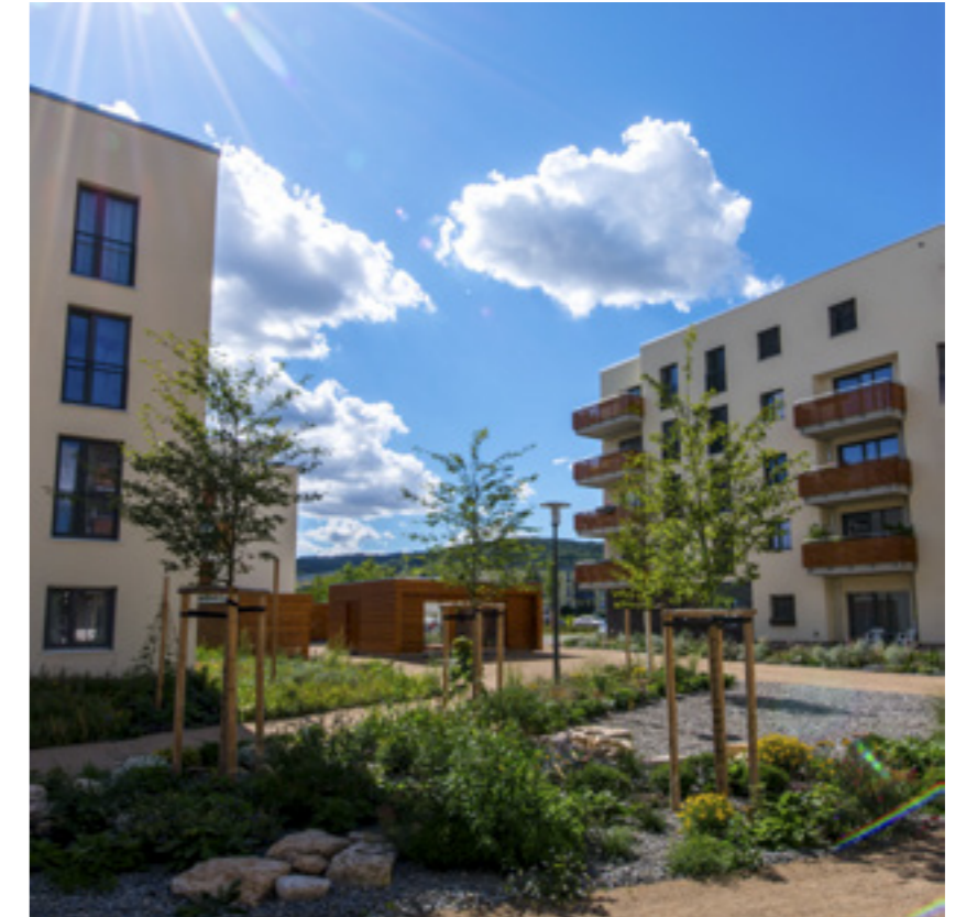
Innenhof 2