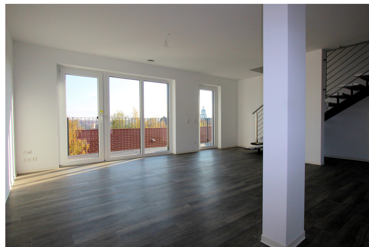
Wohnzimmer Maisonette; SWG Altenburg mbH