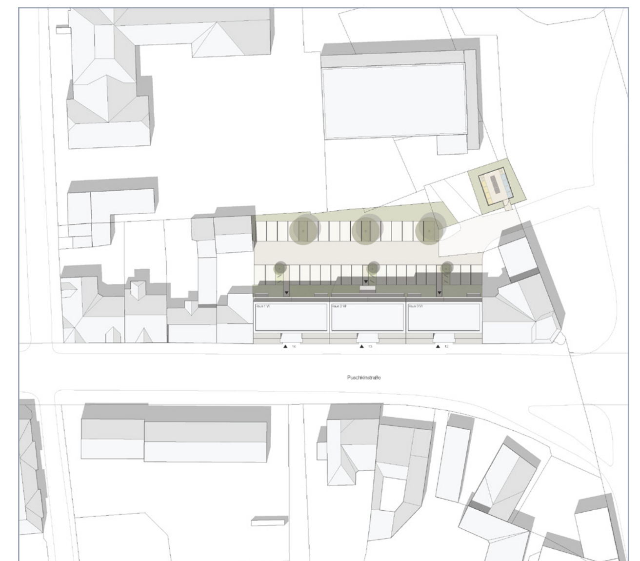
Lage im Quartier; alle Pläne: ABOA Architekten GmbH