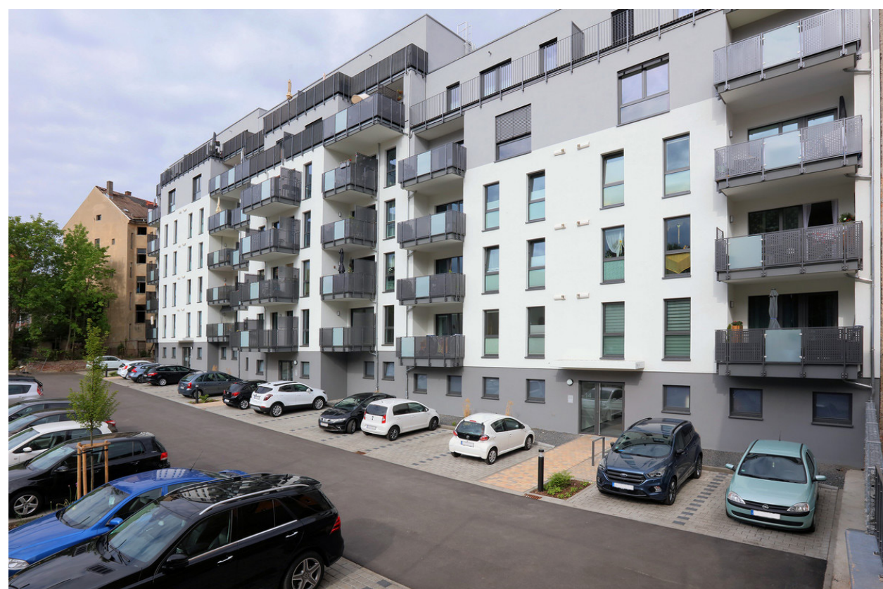
Außenansicht hofseitig