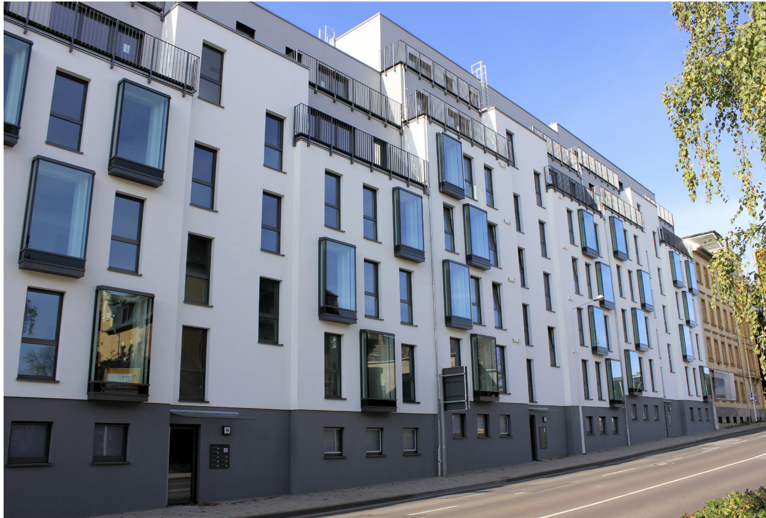
Außenansicht straßenseitig; SWG Altenburg mbH