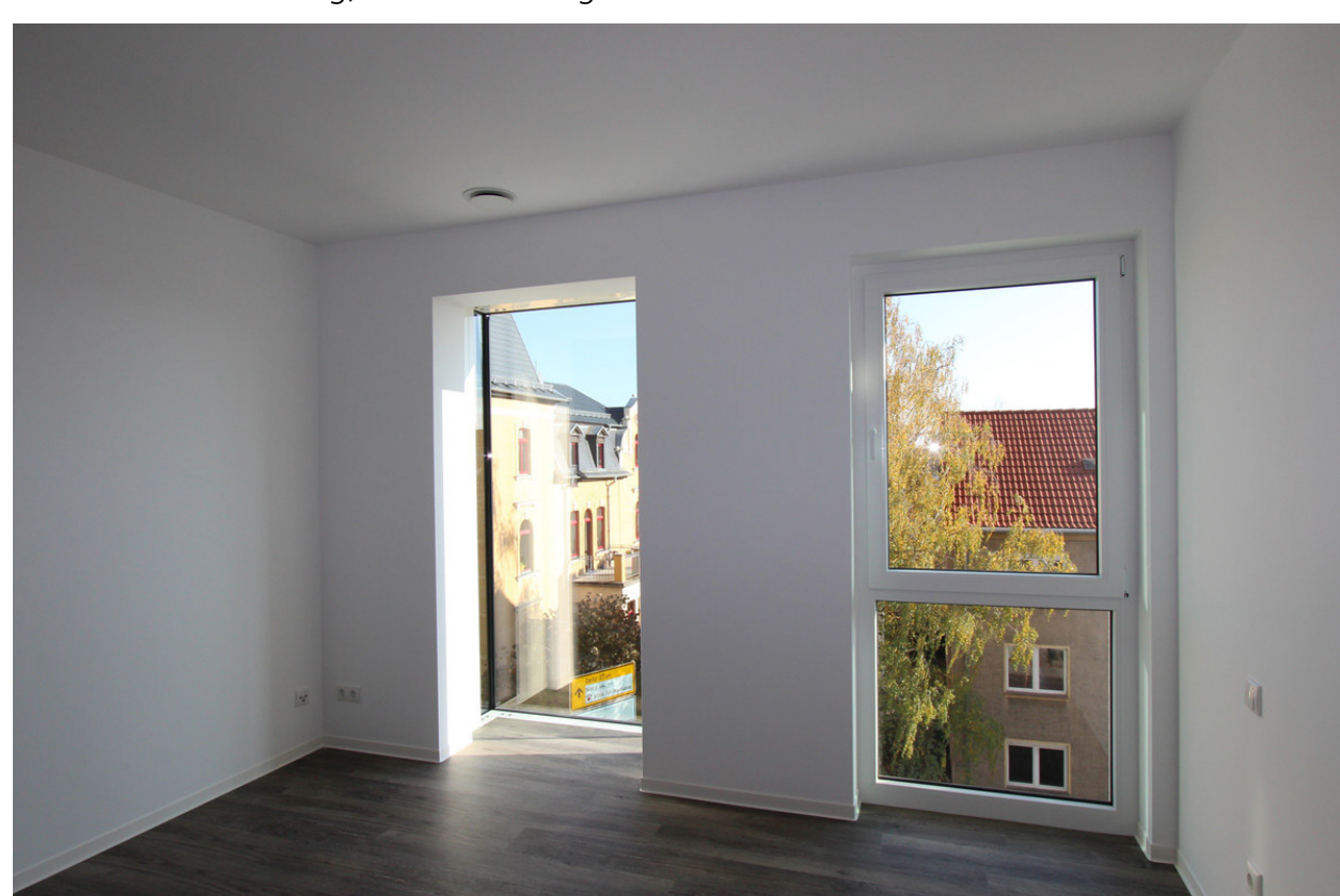
Schlafzimmer mit Erker; SWG Altenburg mbH