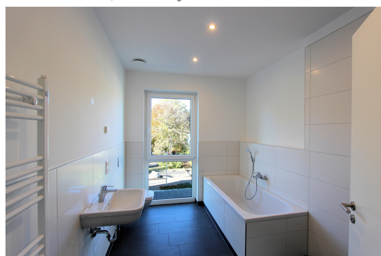
Bad; SWG Altenburg mbH