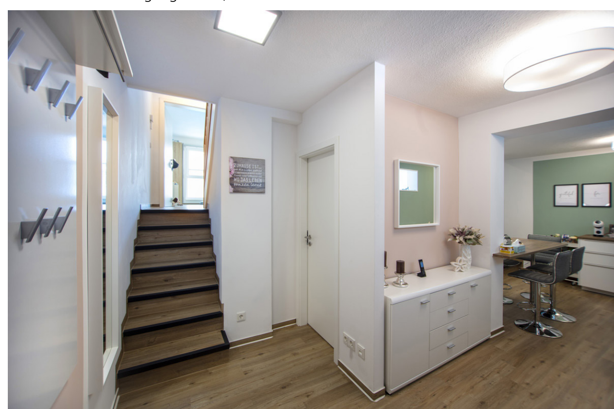
Wohnung, Eingangsbereich mit Halbtreppe; Studio1 Kommunikation GmbH