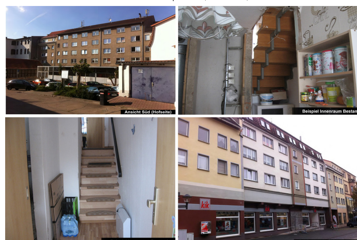
Collage zum Altbestand; Architekturbüro R. Brodmann