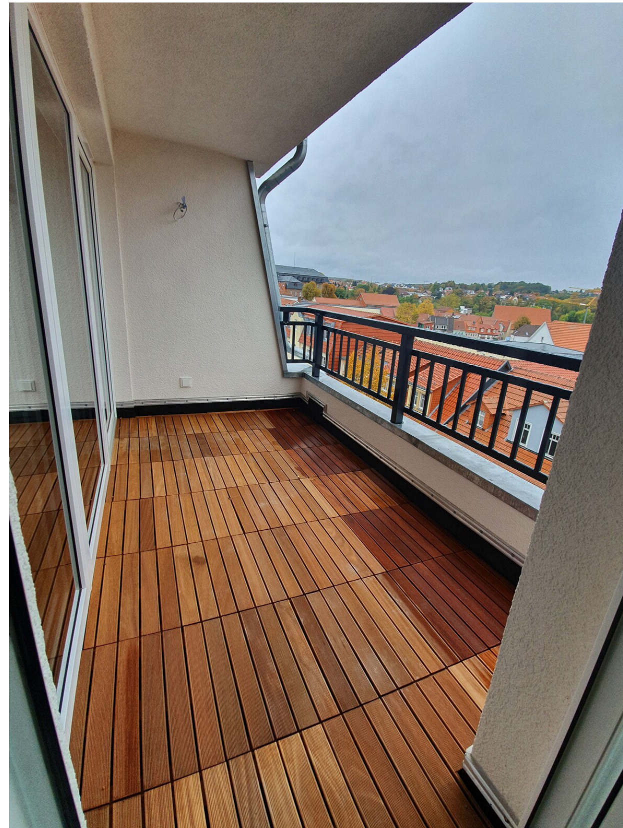
DG-Wohnung mit Terrasse; Christin Anschütz