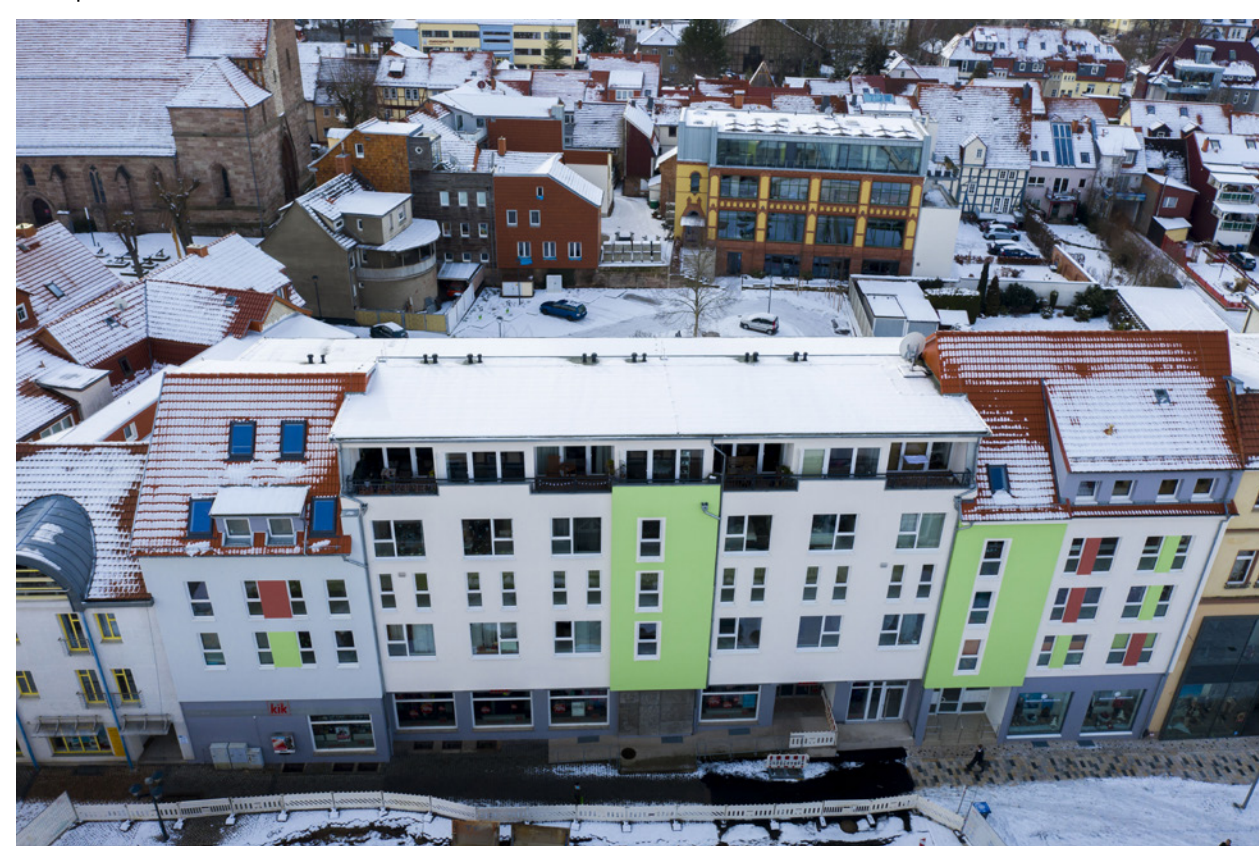
Nordfassade zur Fußgängerzone