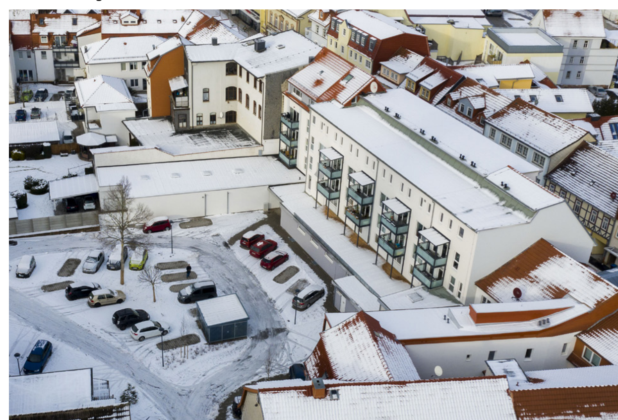
Südfassade mit Balkonen und Hof mit Parkplätzen (Ausschnitt)