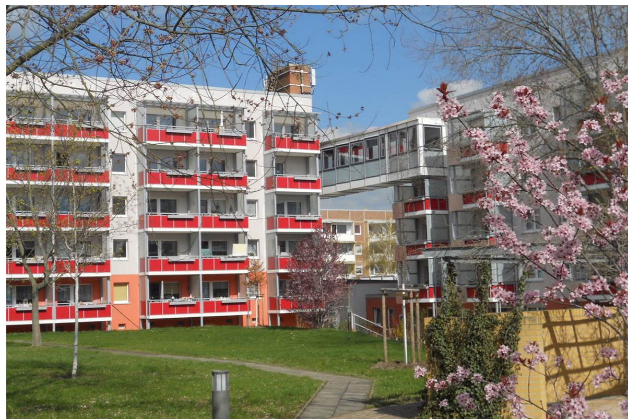
Gemeinsamer Innenhof mit Sitzrandell, Blick auf Verbindungsbrücke und Saalbau; VWG