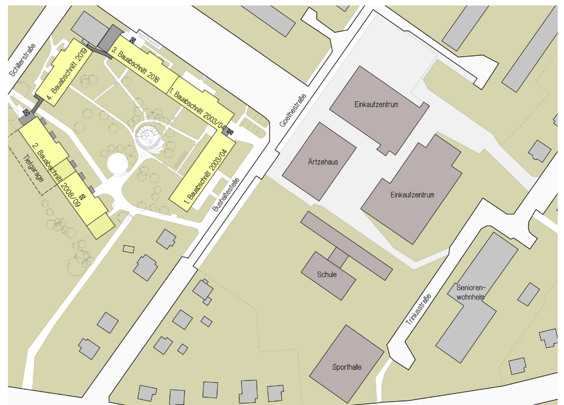
Städtebauliche Einordnung; PHLOX