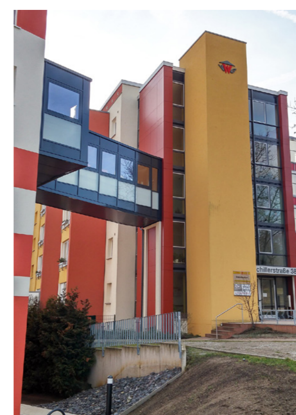
Barrierefreie Brücke über Eck; PHLOX