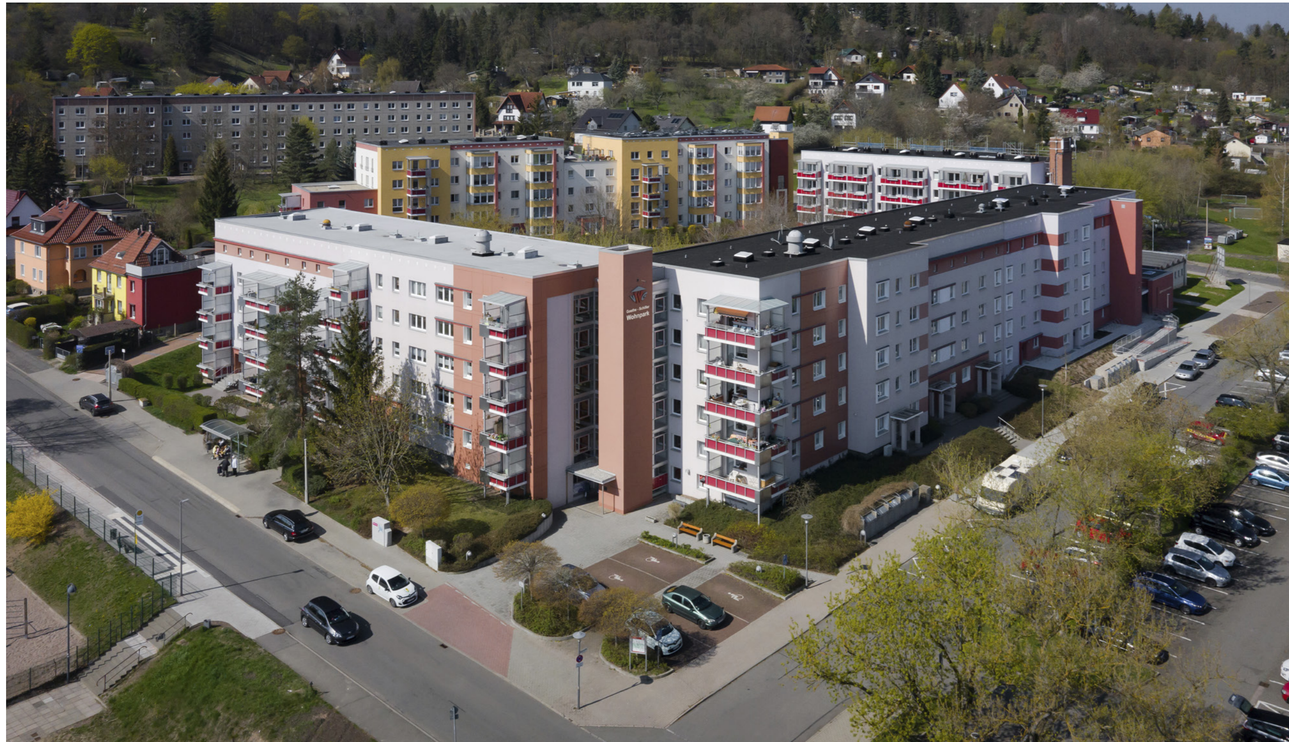
Aufsicht auf den Goethe-Schiller-Wohnpark; A. Kranert

PHLOX Architekt & Ingenieur GmbH, Weimar