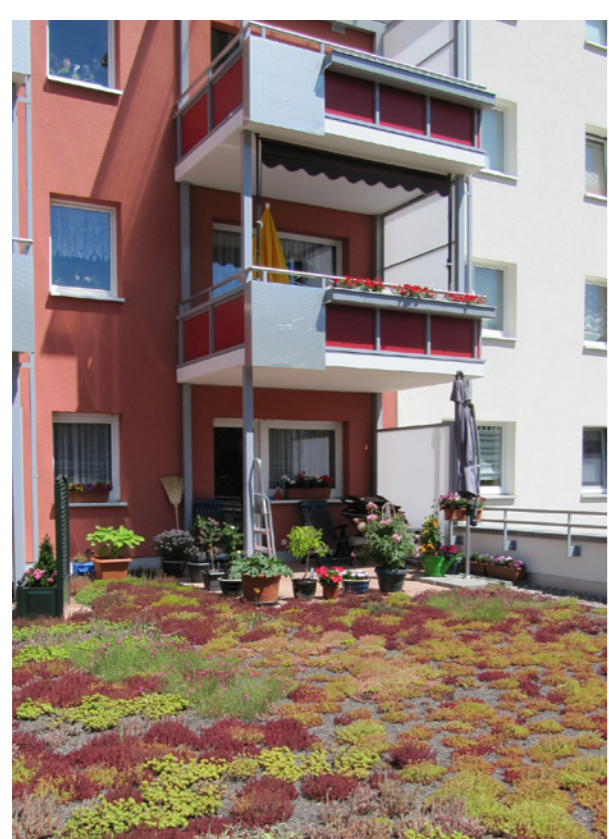
Gründach auf Tiefgarage; VWG