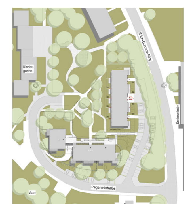
offene Struktur nach dem Umbau; PHLOX