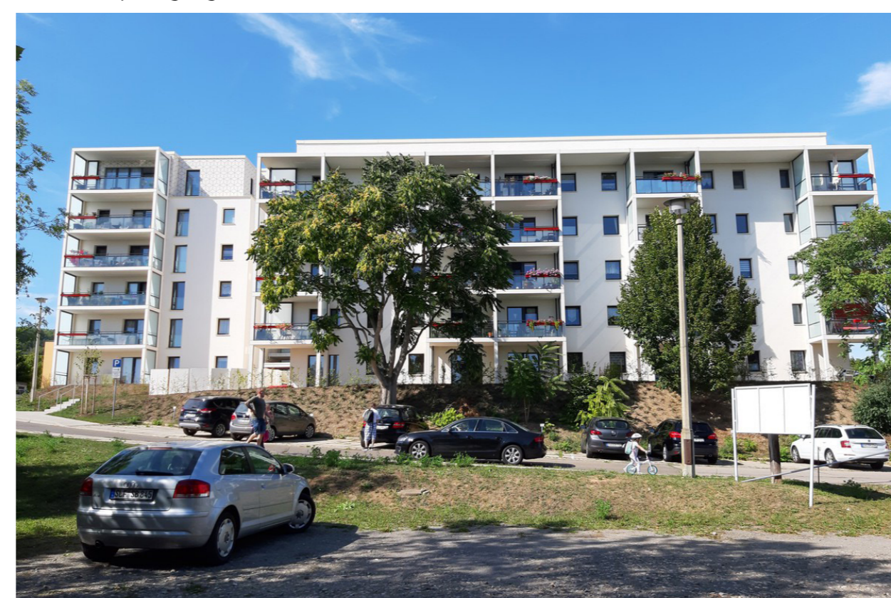
Gesamtansicht Süden; A. Braun