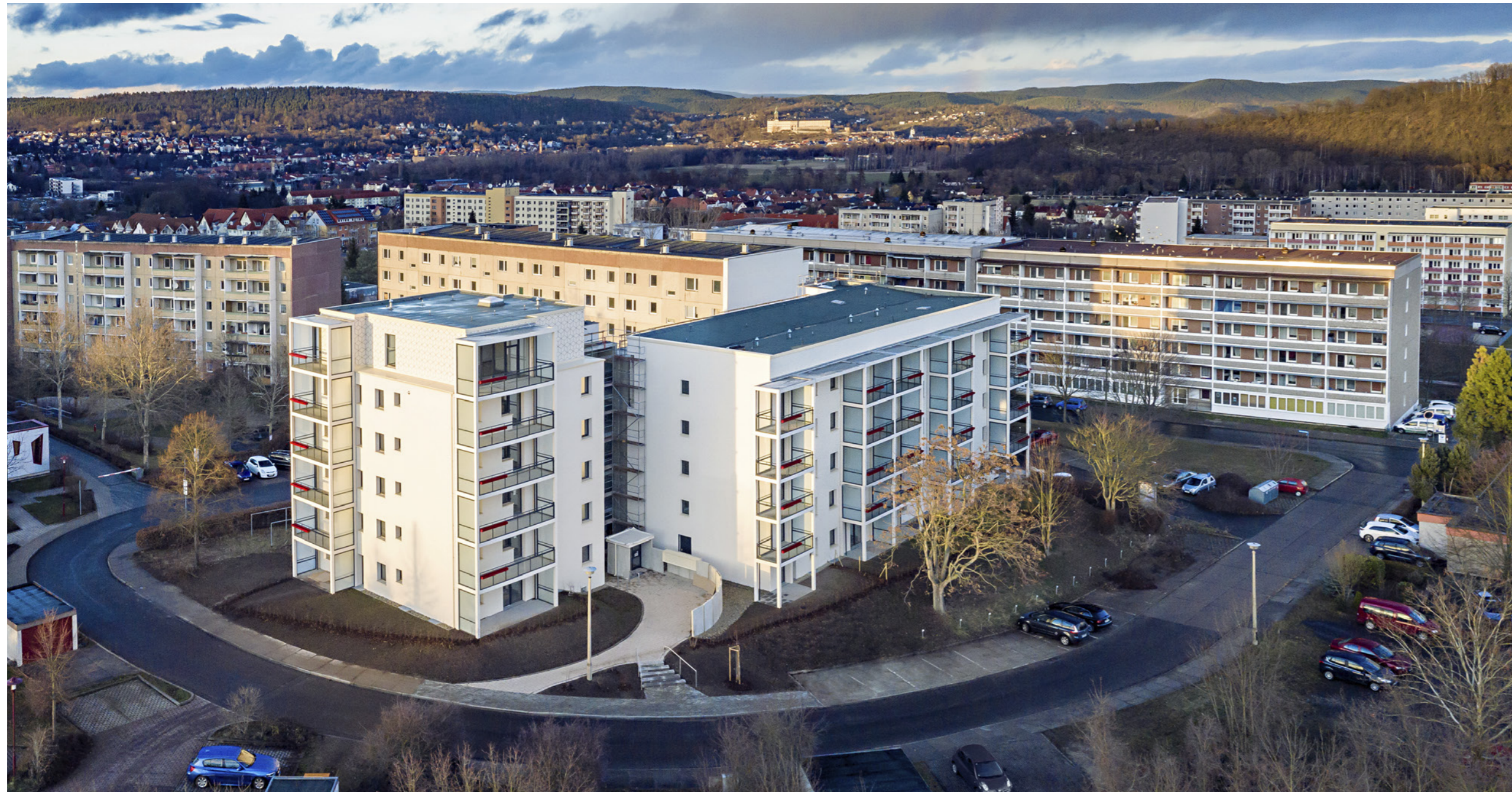
Gesamtansicht aus der Vogelperspektive (Ausschnitt); A. Kranert