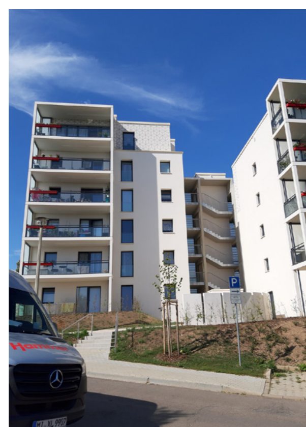
Neuer Haupteingang; A. Braun