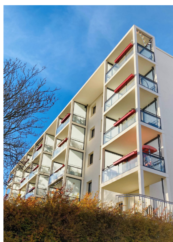
Balkone mit durchsichtiger Brüstung für besten Weitblick; PHLOX