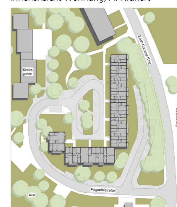
Blockrand vor dem Umbau; PHLOX