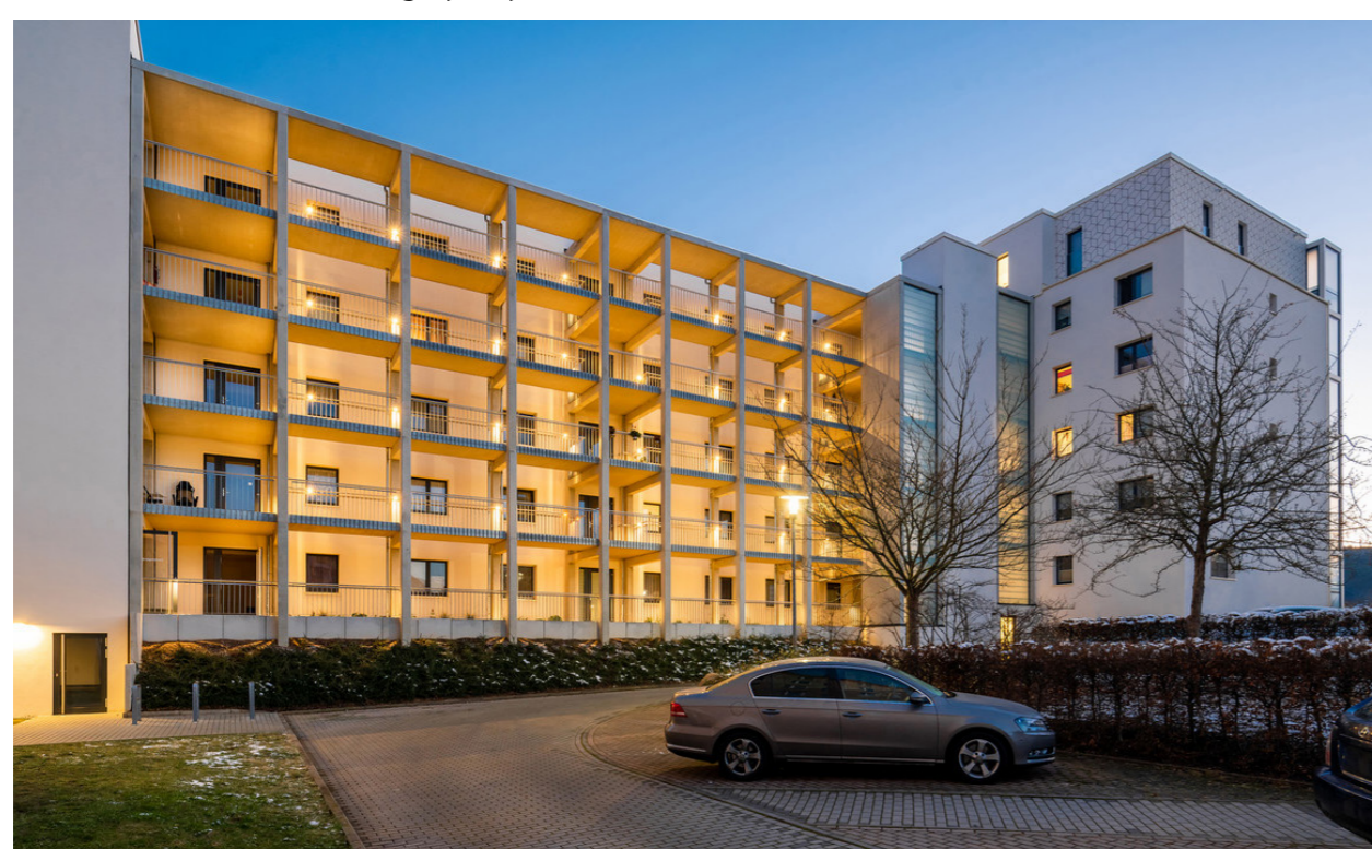
Hoffassade am Abend; A. Kranert