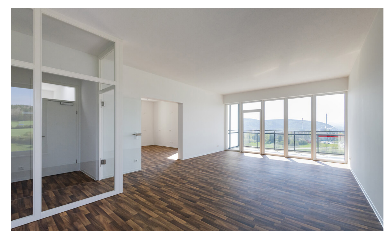
Innenansicht Wohnung; A. Kranert